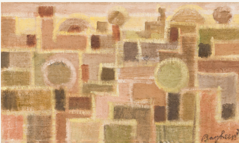
Oase 1973 Öl auf Leinwand 30 x 51 cm Rechts unten signiert, datiert: Bargheer 73