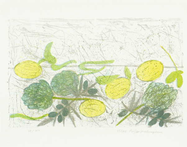
Stilleben mit Artischocken 1967 Serie Griechenland-Mappe (4/7)