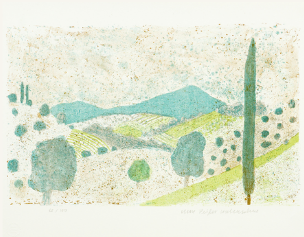
Arkadische Landschaft 1967 Serie Griechenland-Mappe (2/7)