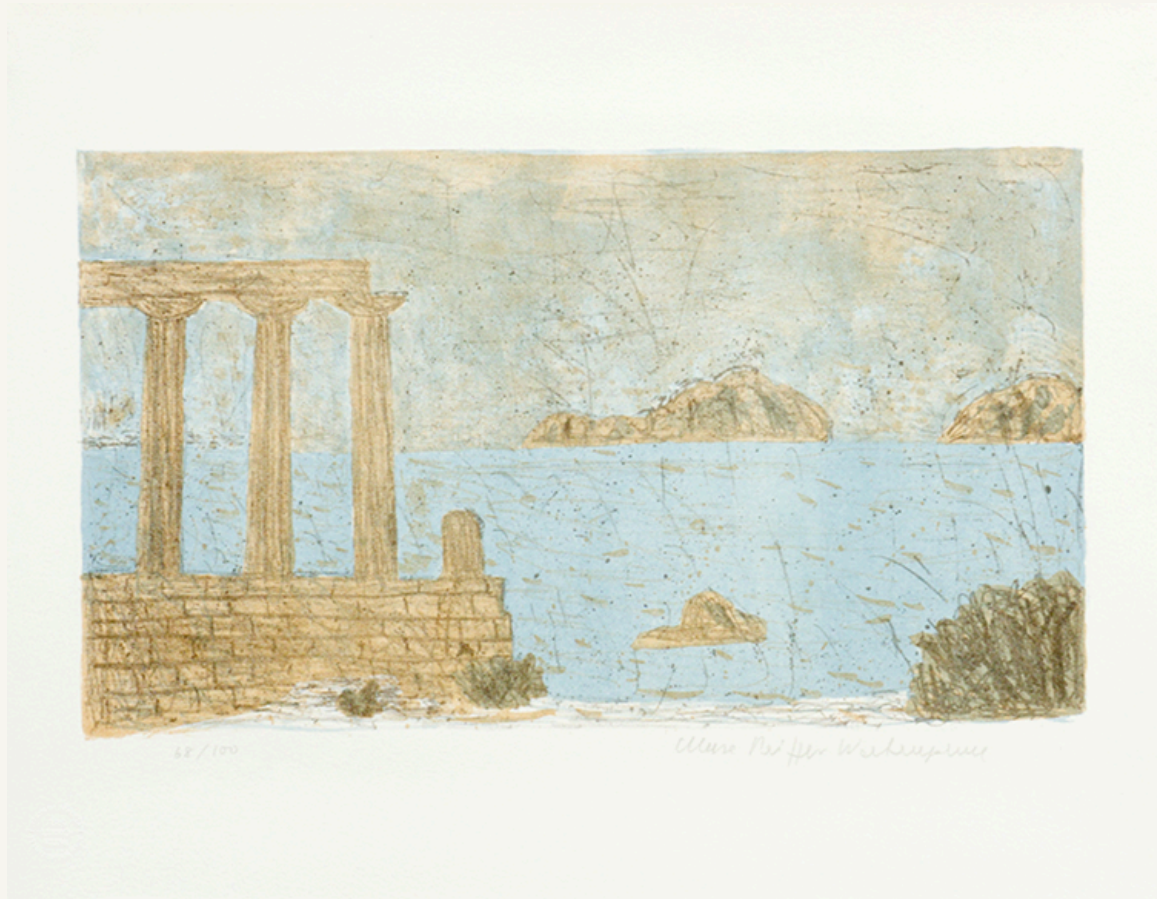
Tempel am Meer 1967 Originalfarblithografie, 68/100 39,5 x 50,5 cm Rechts unten signiert Werkverzeichnis Pasqualucci D95 Serie Griechenland-Mappe (1/7)