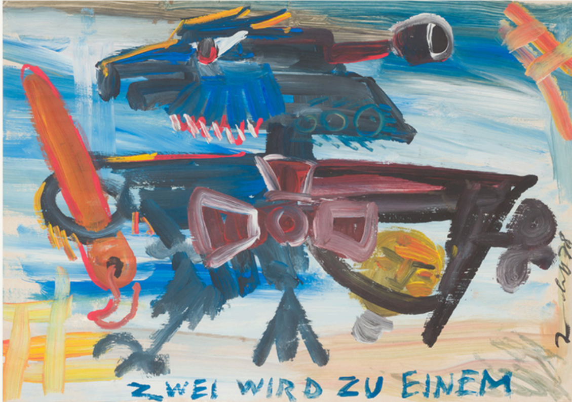
Zwei wird zu Einem 1978