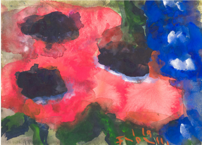
Mohn und Rittersporn 2019 Aquarell und Gouache 22 x 30,7 cm Signiert, datiert