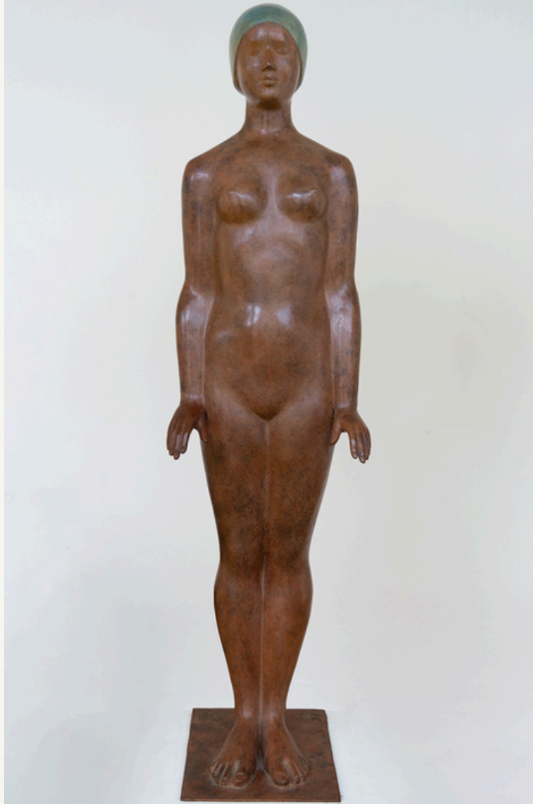
Schwimmerin 1997 Bronze, 2/6 Höhe 125 cm Monogrammiert: KHK