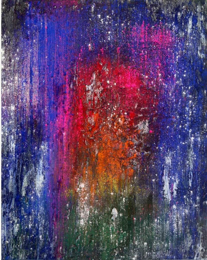
Ohne Titel 2024 Öl und Pigment auf Leinwand 100 x 80 cm Rückseitig signiert