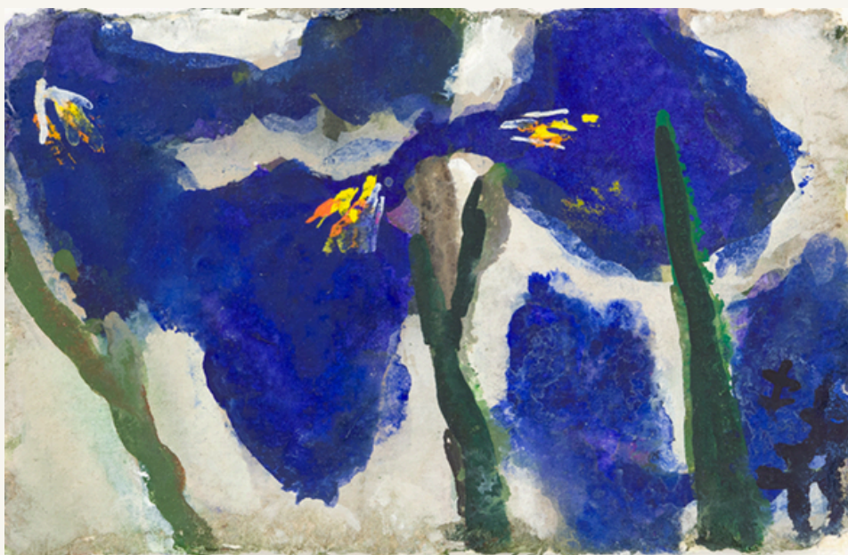
Iris 2021 Aquarell 10 x 15 cm Signiert, datiert