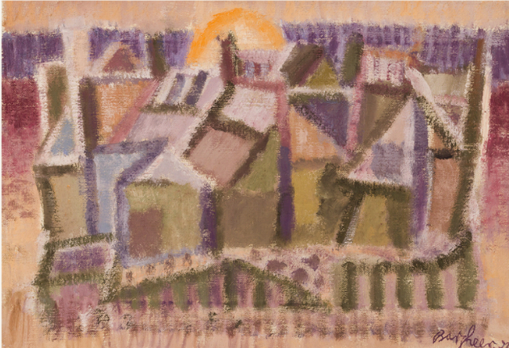
Fischerinsel Saint Louis 1972 Öl auf Leinwand 34 x 48,5 cm Rechts unten signiert, datiert: Bargheer 72