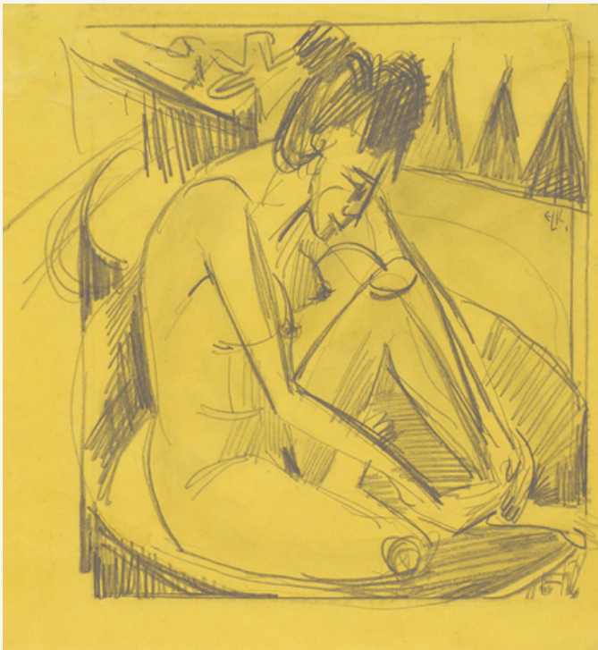
Badende im Tub um 1920 Bleistift auf gelbem Papier 24,2 x 22,5 cm Rechts oben monogrammiert ELK