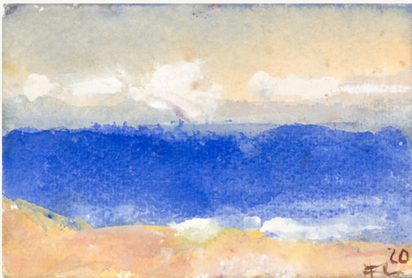
Ostseestrand 2020 Aquarell 10 x 15 cm Signiert, datiert