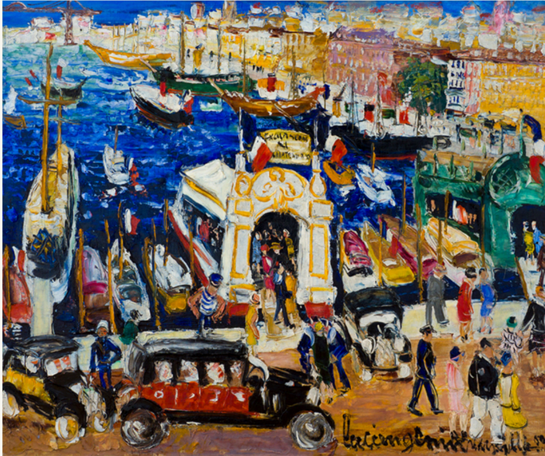
Alter Hafen in Marseille 1939 Öl auf Leinwand 60 x 72 cm Rechts unten signiert: luciengenin