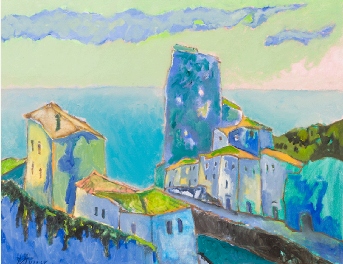
Häuser in der Bucht von Lerici