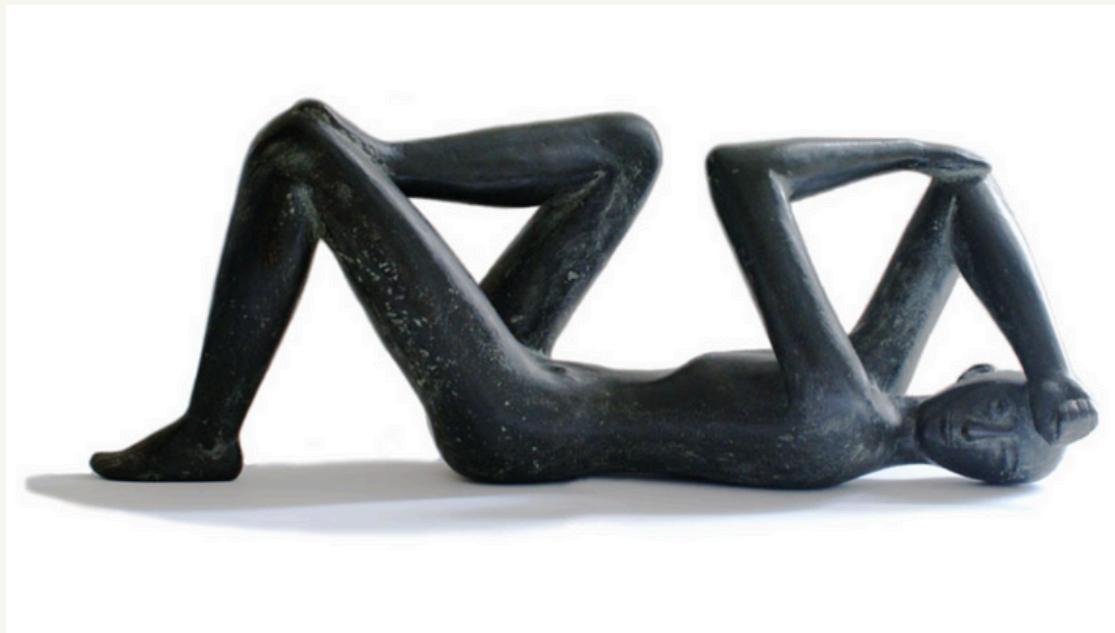
Tekton 1957 Bronze, 4/5 19 x 48 x 14 cm Monogrammiert: KHK