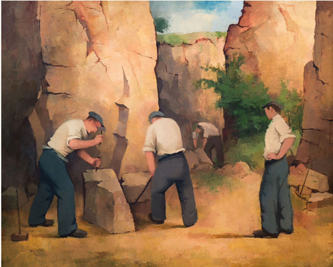
Steinbruch 1948 Öl auf Leinwand 95 x 120 cm