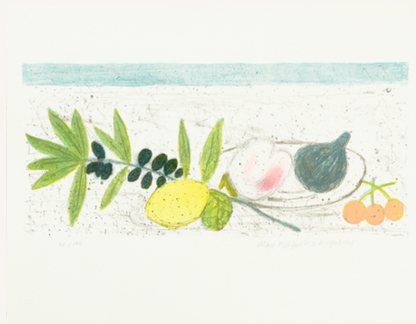
Schale mit Früchten 1967 Serie Griechenland-Mappe (7/7)