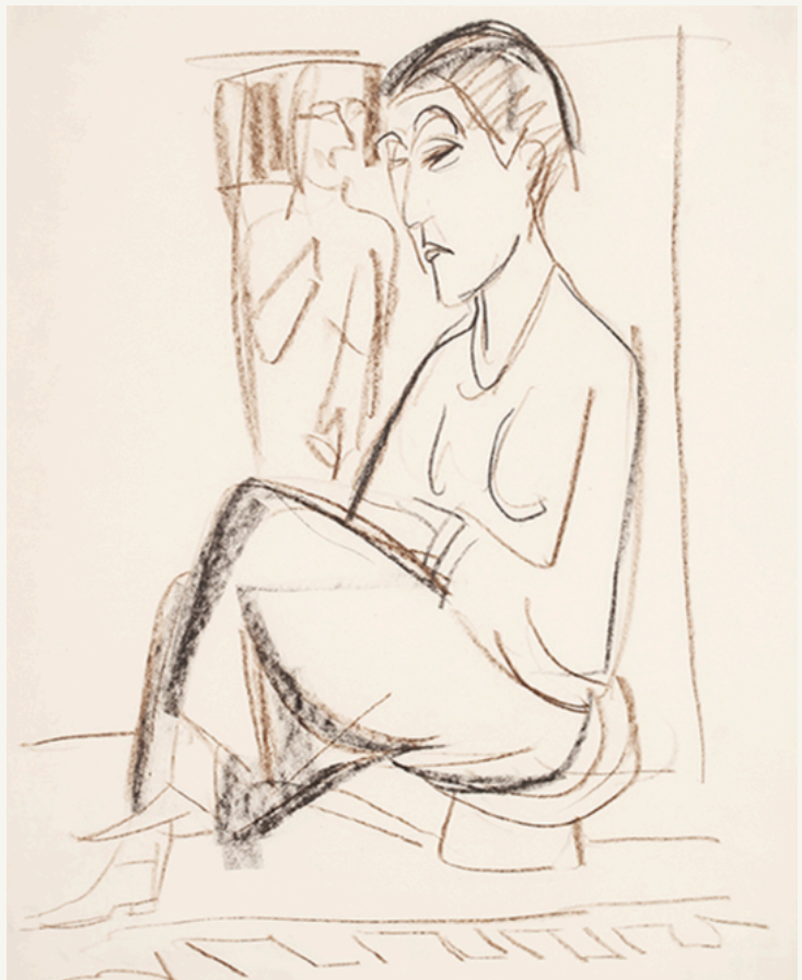
Erna vor geschnitztem Stuhl um 1924 Kreidezeichnung 49 x 41 cm Rückseitig mit dem Nachlassstempel und den Nummerierungen "FS Da/Ba 47", "K 6133", "C 3786" und "5767" bezeichnet