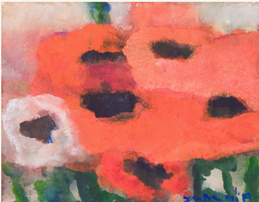
Mohnblumen 2019 Aquarell und Gouache 28 x 38 cm Signiert, datiert