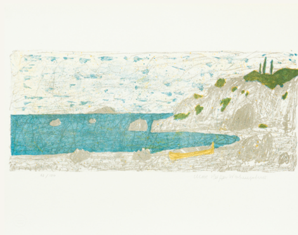
Die Bucht 1967 Serie Griechenland-Mappe (5/7)