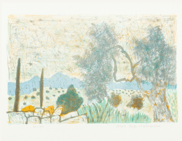
Der alte Ölbaum 1967 Serie Griechenland-Mappe (6/7)