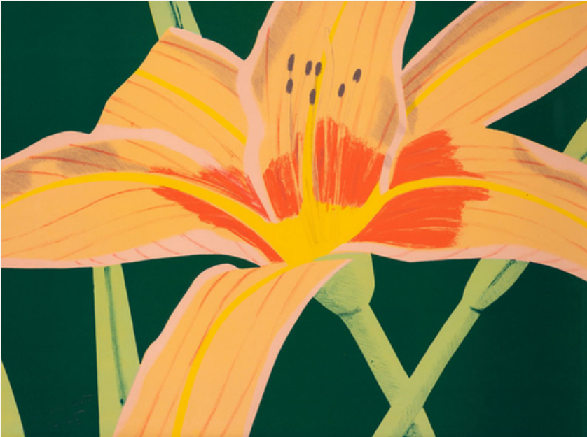
Day Lily 1 1969 Originalfarblithographie 52,4 x 70,8 cm Edition: 90 + AP Links unten signiert: Alex Katz Werkverzeichnis Marvell 23, Schröder et al. 25