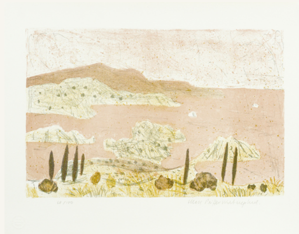
Inselblick 1967 Serie Griechenland-Mappe (3/7)