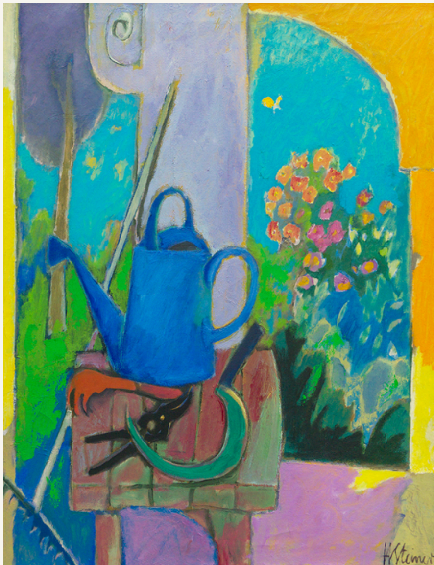
Stilleben auf der Loggia in Lerici Öl auf Leinwand 80 x 60 cm Rechts unten signiert: HSteiner