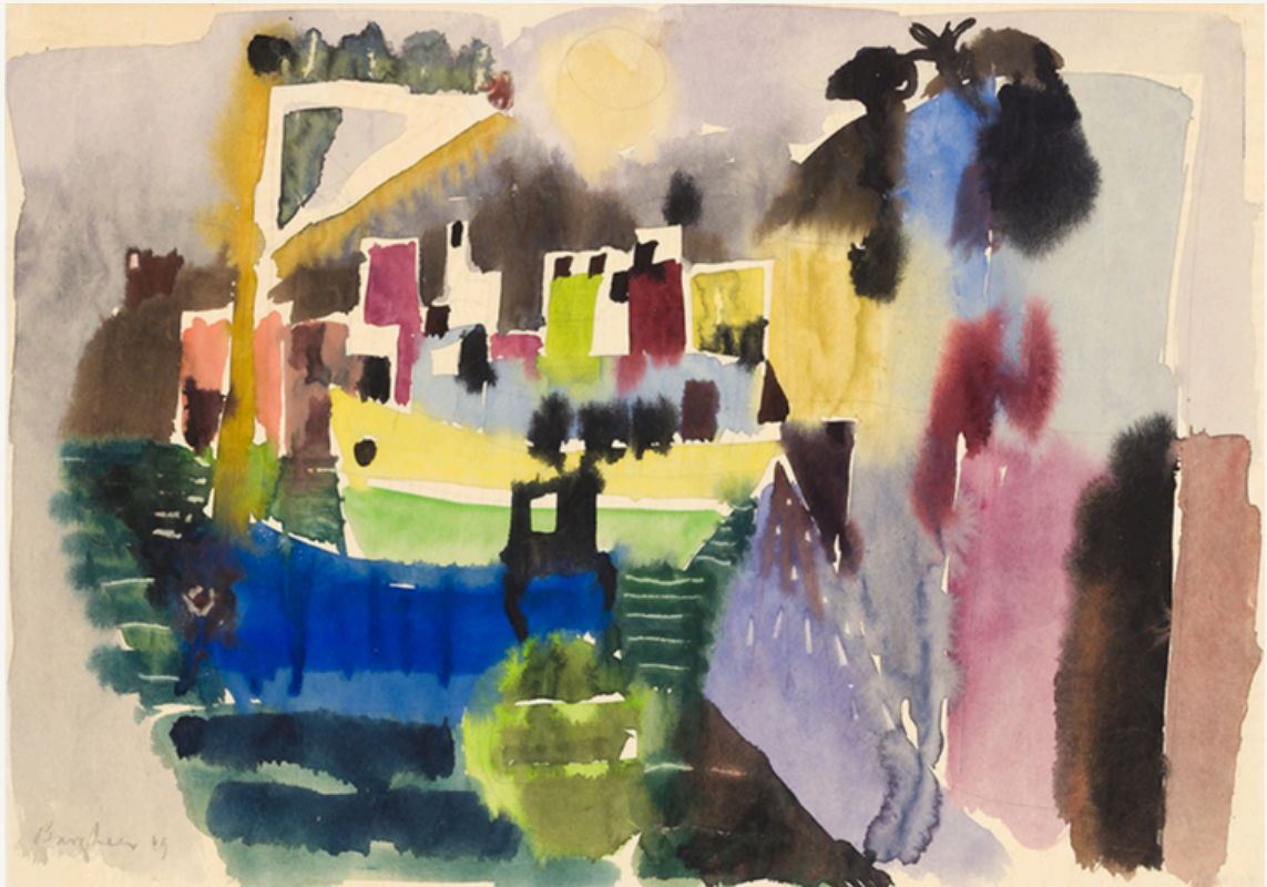
Porto d'Ischia mit aufgehendem Vollmond 1949